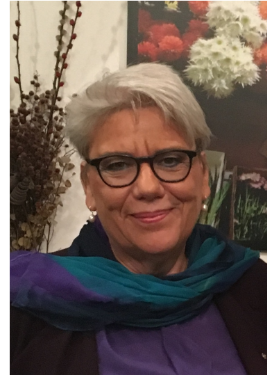
Juristin verheiratet zwei erwachsene Töchter seit 1991 Mitglied bei den Grünen

Der letzte veröffentlichte Rechenschaftsbericht der Grünen umfasste ein Volumen von mehr als 40 Millionen Euro. Das Geld der Partei ist in hohem Maße das Geld der Mitglieder: Mitgliedsbeiträge und -spenden, der Beitrag der Mitglieder zu Wahlkämpfen und gute Wahlergebnisse sind die Grundlage für solide Parteifinanzen. Ergänzt werden sie durch ein transparentes und professionelles Fundraising mit klaren Regeln. Verantwortung, Verantwortlichkeit und Transparenz bei der Parteienfinanzierung – da sind wir Grünen weiterhin gefragt, Maßstäbe zu setzen. Das ist mir ein zentrales Anliegen. Grundlage wie Ziel bleibt die gesellschaftliche und politische Verankerung. Denn wir wollen mit guten Wahlergebnissen diese Republik erneuern.